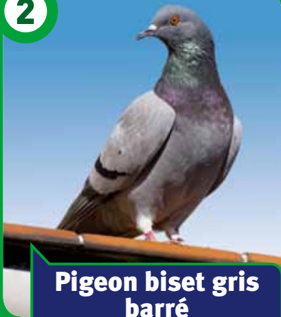
Pigeon biset gris barré