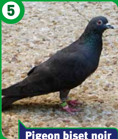
Pigeon biset noir

Comme tous les pigeons bisets, je suis omnivore.